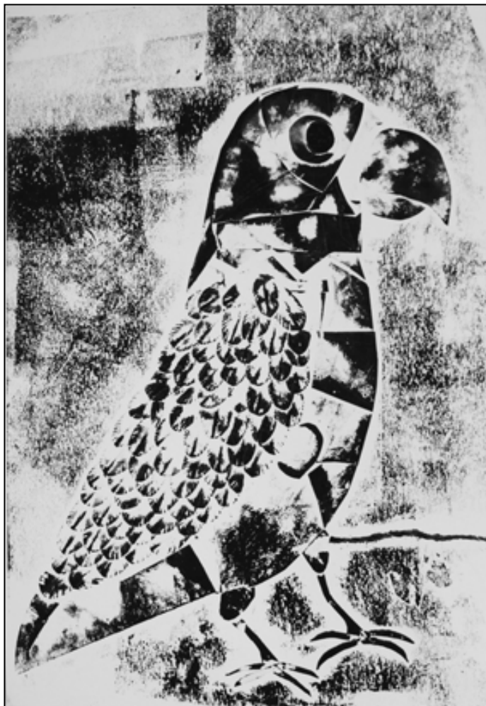
René Bíbrová, 10 let