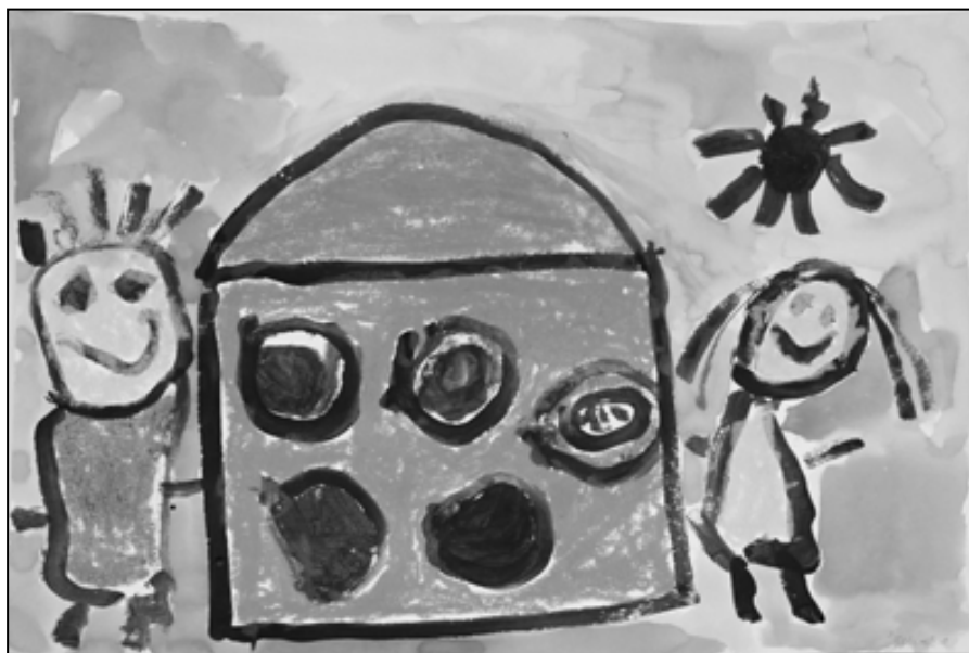
Nella Steinhauerová, 4 roky