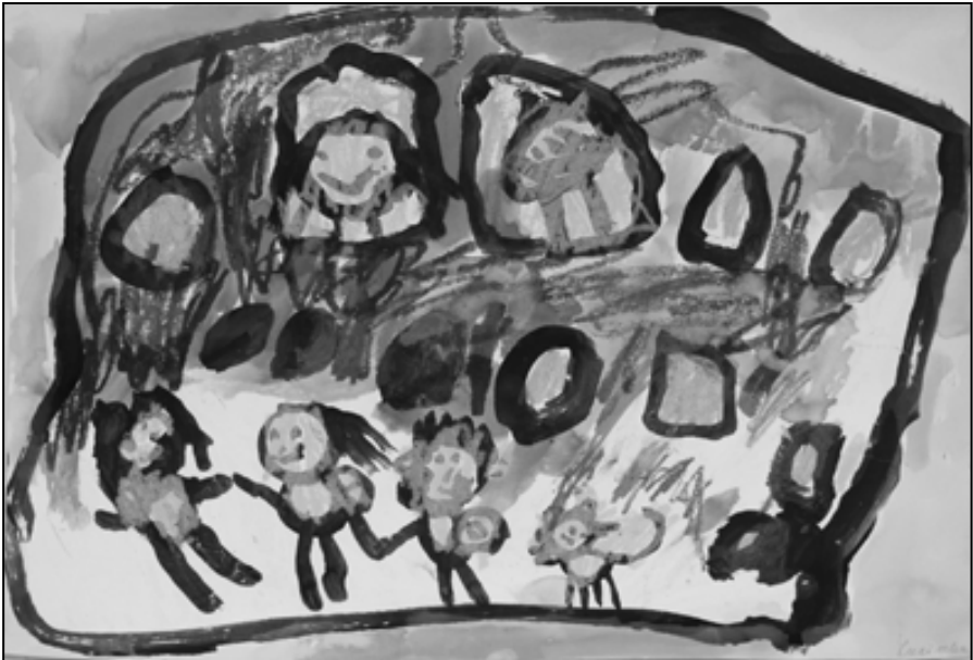
Lucie Sýkorová, 3 roky