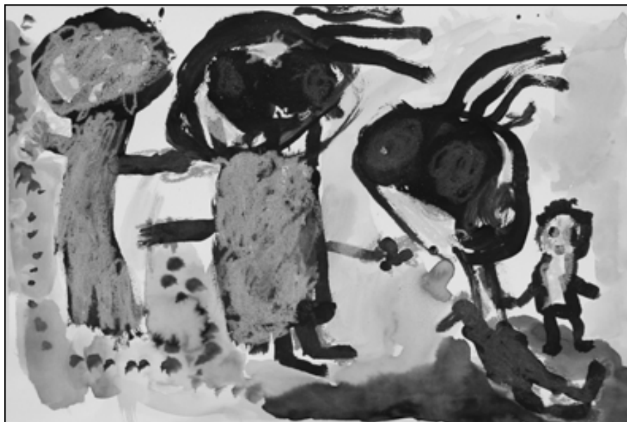
Matyáš Peksa, 4 roky