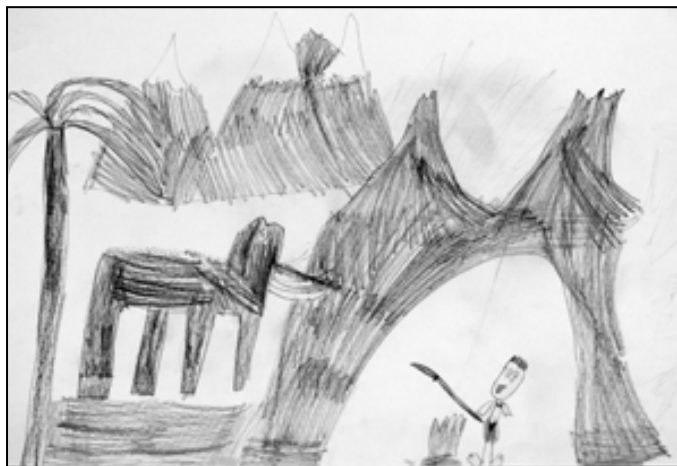
Anežka Svozilová, 7 let